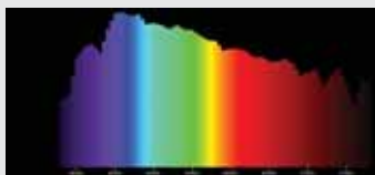
Denní světlo (D 65)

Viditelná oblast od 380 do 780 nm, relativní spektrální emise na 5 nm.